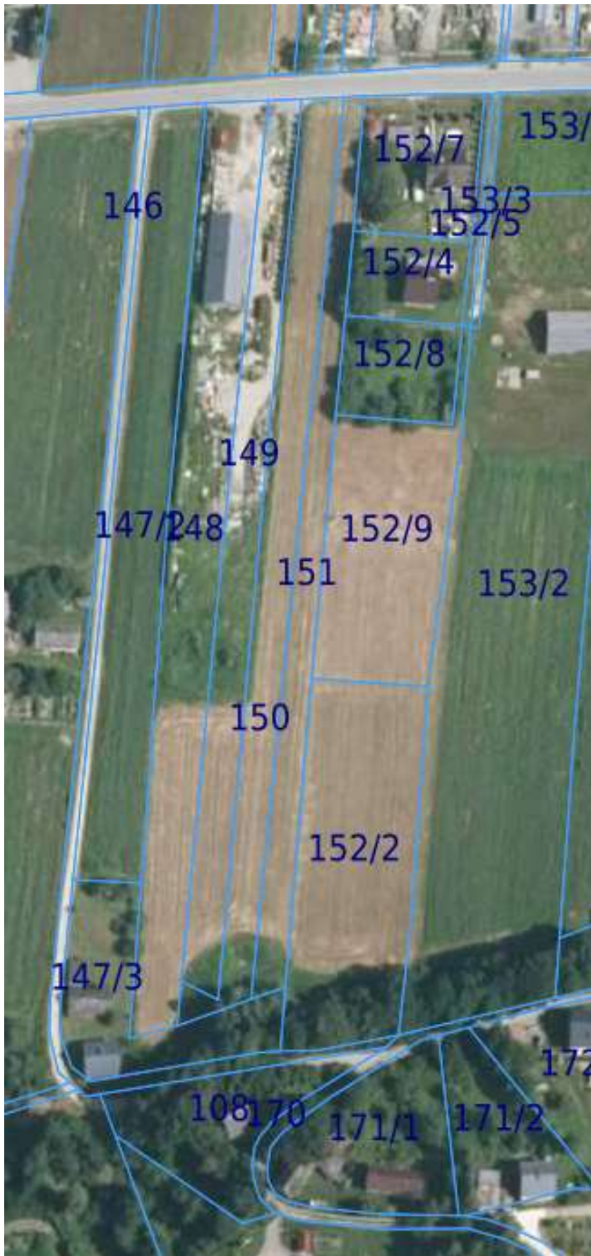
Zrzut ekranu – GEOPORTAL -dz. 146 obr. Zagórze