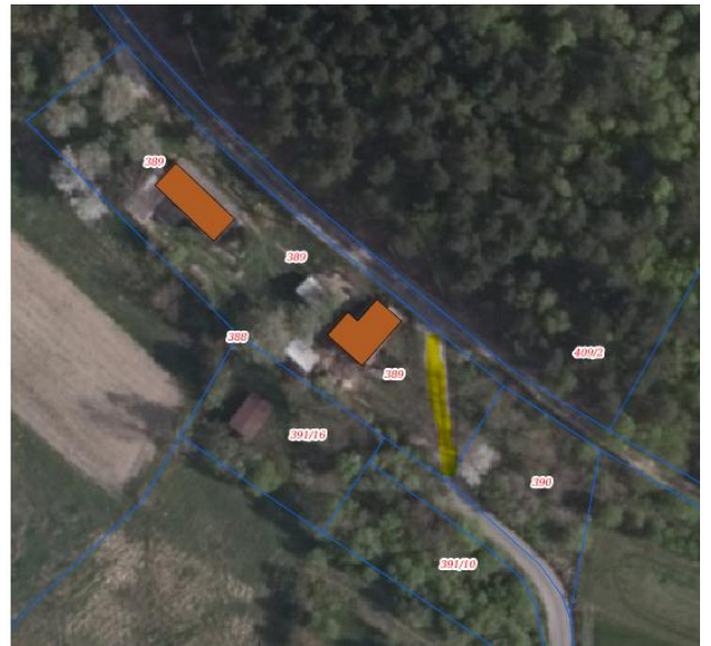
Lokalizacja drogi wewnętrznej na dz. 389/1 Rożnów