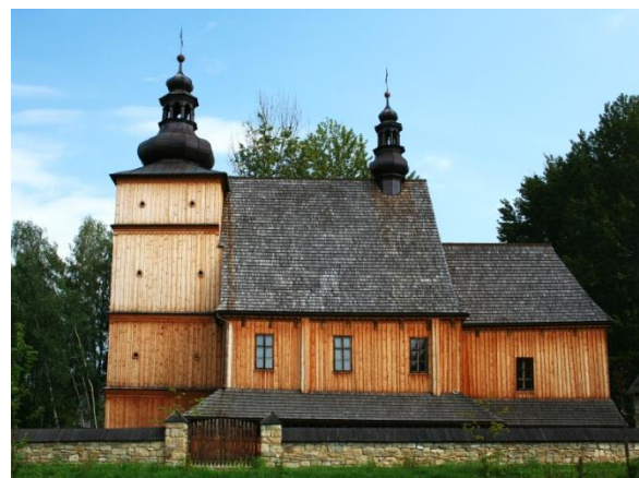
Kościół z Łososiny Dolnej przeniesiony do Sąddeckiego Parku Etnograficznego