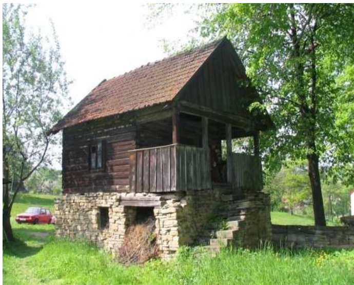
Spichlerz z pocz. XX w.