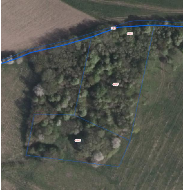
Jelna dz. 46/2 i 46/3